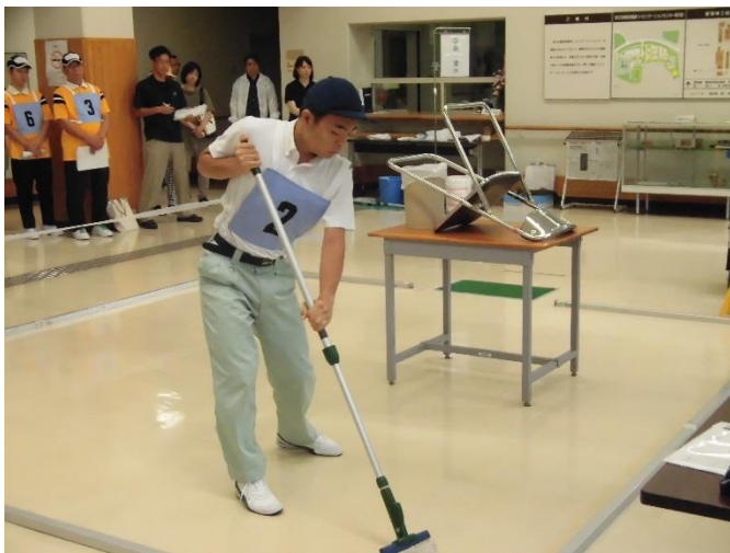
綺麗なモップさばきで会場を魅了