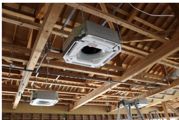
(実習棟天井部の様子)