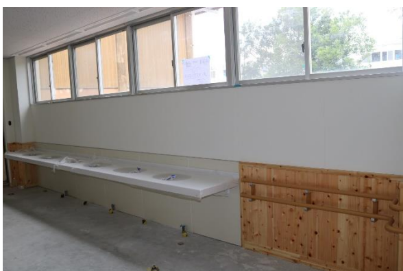
(ランチルーム入口の様子)