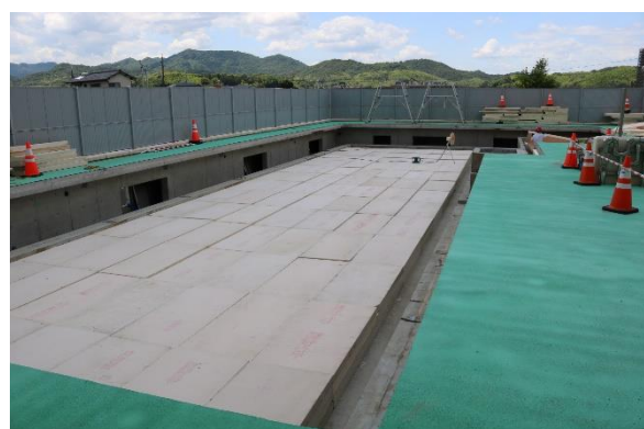
(屋外プールの様子)