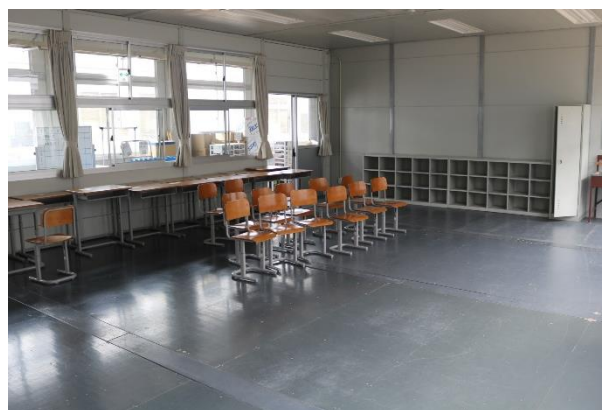
(プレハブ校舎の様子)