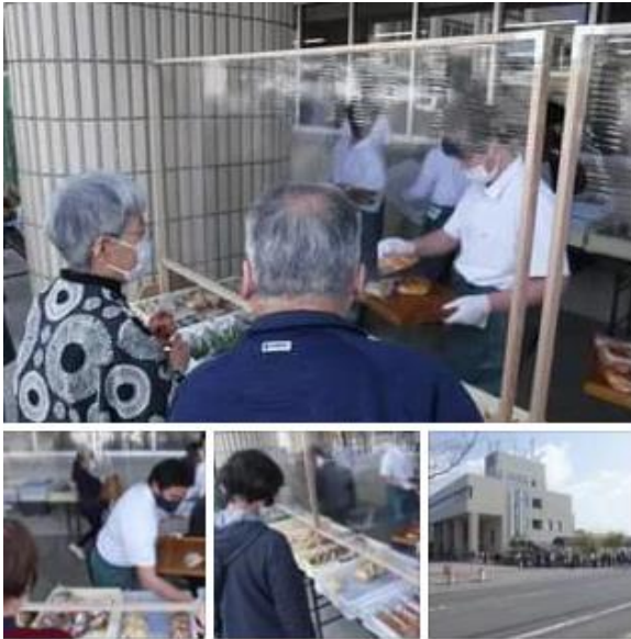
真備支所前でのパンの販売に